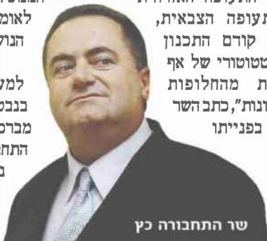
שר התחבורה כץ

צוניים. "בשנים האחרונות התקבלו החלטות רבות לקדם זמינות של שדה תעופה, אך בשל התנגדויות של גופים שונים וחילוקי דעות בין התעופה האזרחית והתעופה הצבאית, לא קודם התכנון הסטטוטורי של אף אחת מהחלופות השונות", כתב השר כץ בפנייתו