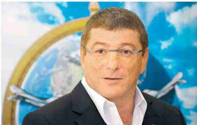
אליעזר שקדי. "בעיות שניתן לפתור"

מפקד חיל האוויר לשעבר תומך בהקמת שדה תעופה בינלאומי בנבטים, בניגוד לעמדת המשרד שדורש שהשדה יוקם במגידו