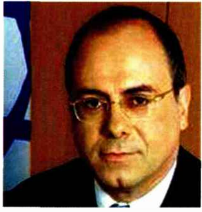
סילבן שלום, השר לפיתוח הנגב והגליל