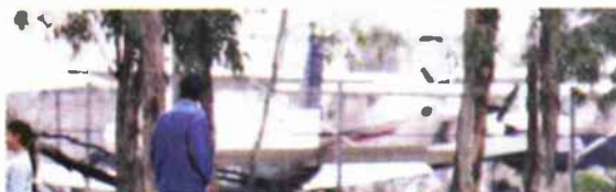
שדה תעופה מגידו.

לקריאת ראשי הרשויות בדרום הציטרפו גם ראשי רשויות רבים בצפון, הדורשים ששדה התעופה לא יוקם במינחת מגידו שבעמק יזרעאל.